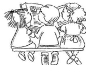
Sharing the Story

1. What is it that this ¿Qué ha cambiado esta Asamblea en usted, en su modo de pensar?