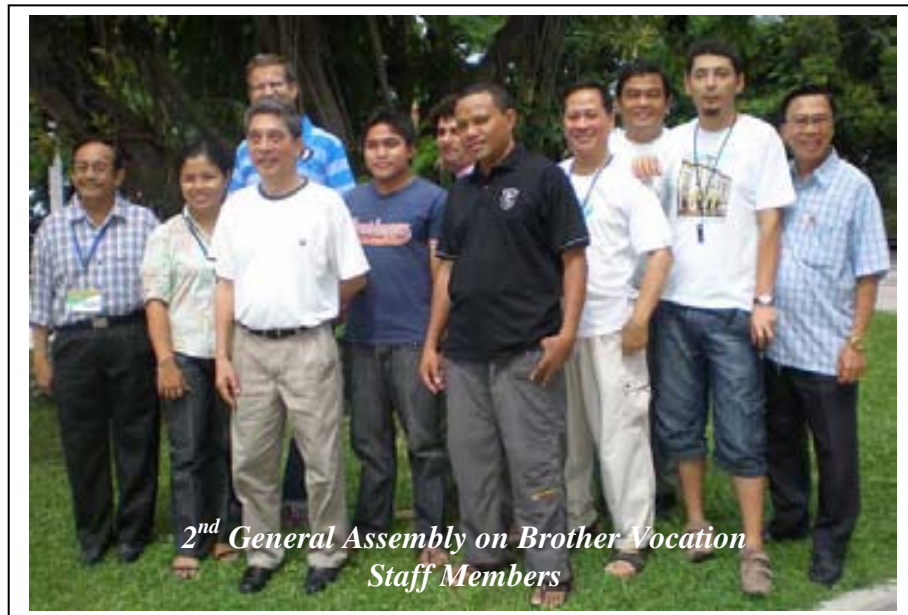
2 nd General Assembly on Brother Vocation Staff Members