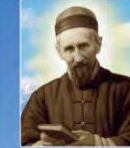
St. Joseph Freinademetz