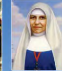
Bl. Josefa Hendrina